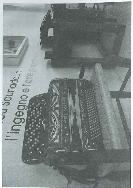
10 anni dall'inaugurazione